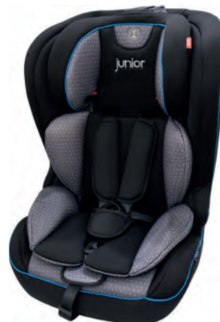
Design 803 - 44440418