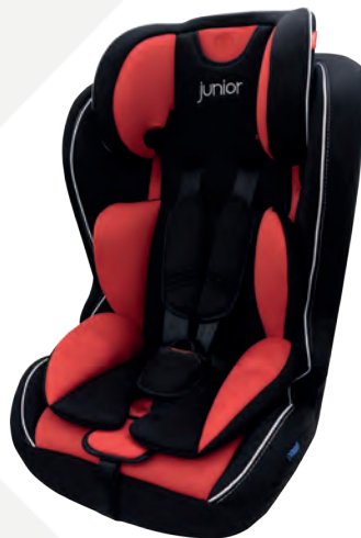
Design 801 - 44440412