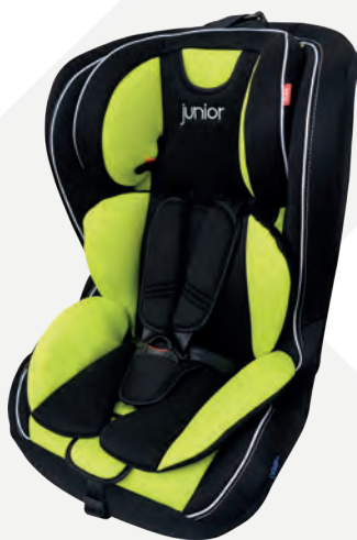
Design 802 - 44440413