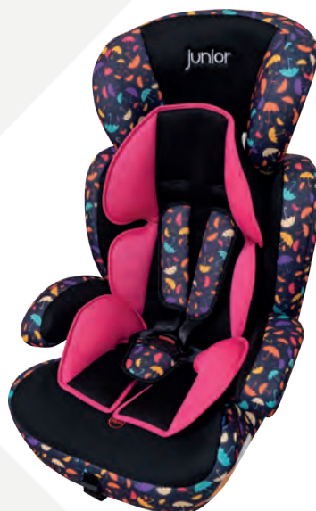
Design 602 - 44440012