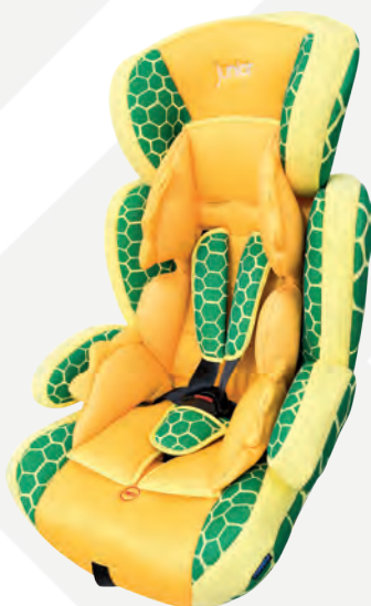
Design 603 - 44440019