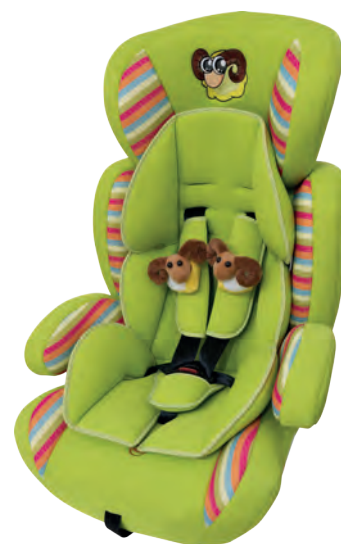
Design 601 - 44440013