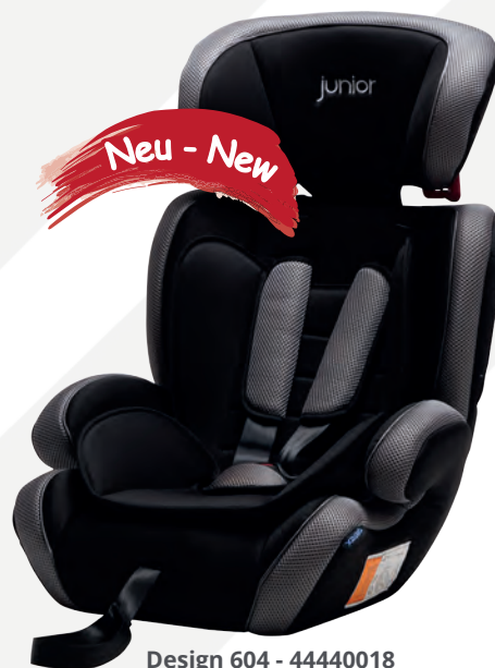
Design 604 - 44440018

CHILDREN SEAT ECE R44/04 UNIVERSAL 9-36kg E 13 045048 Group I/II/III